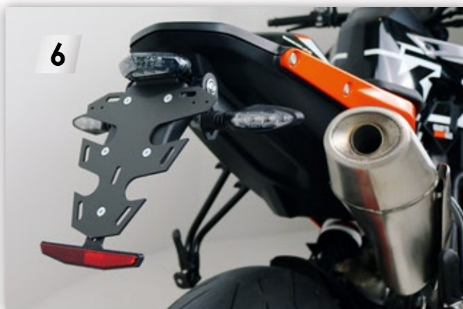
MIZU FLY-Design Kennzeichenträger montieren Mount MIZU FLY design license plate holder